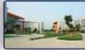
Mahindra World City