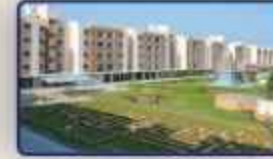
Shriram Sankari Apartment