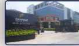
Shriram Gateway (Perungalathur)