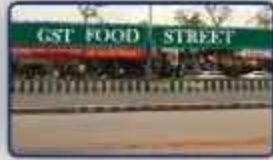
GST Food Street