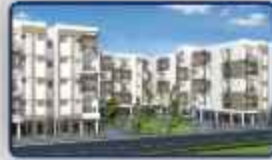
Arun Excello Aparment (Chandrika)