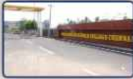
Apollo Arts & Science College