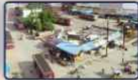
Guduvanchery Bus Stand