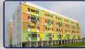
XS Real En Veedu Apartment