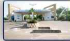
Shri Sathya Sai Medical College & Hospital