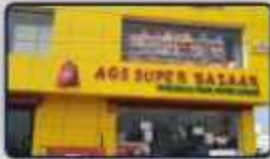
AGS Super Bazaar