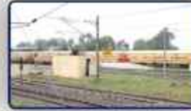
Guduvanchery Railway station