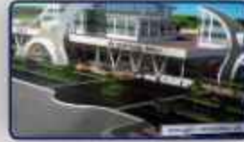
Kilambakkam CMBT Bus Terminus