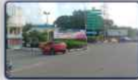
SRM Arts & Science College