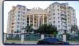
S.I.S Queens Town Apartment